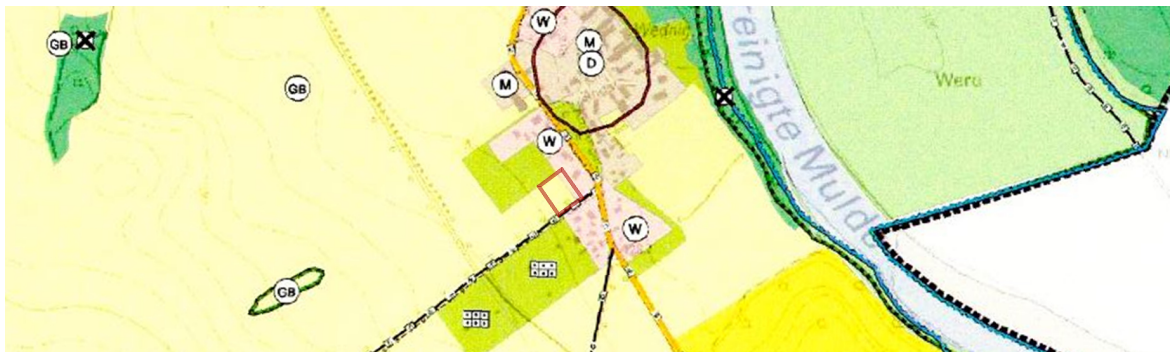
Abb.1: Auszug aus dem Flächennutzungsplan der Stadt Trebsen mit Ergänzungsfäche (rot)

Die angrenzenden Nutzungen werden bei der Planung berücksichtigt, die Ergänzungssatzung steht daher der beabsichtigten städtebaulichen Entwicklung nicht entgegen.