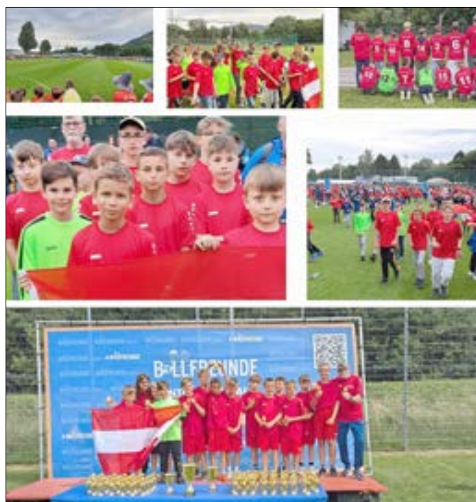
Die D-Jugend und das Trainerteam des SV Trebsen e. V.