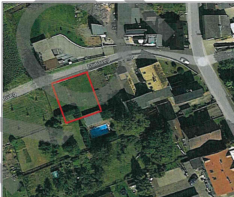
Luftbild Mühlweg Teil des Flurstücks 127/1

Der Standort für den die Klarstellung erfolgen soll, befindet sich auf dem Flurstück 127/1 im Ortsteil Pauschwitz, ca. 1 km vom Stadtzentrum entfernt am Mühlweg. Das Grundstück ist gemäß dem beigefügten Luftbild rot umrandet und hat die Größe von 20 x 20 m