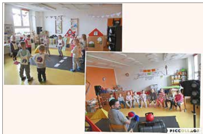
Das Team der Kita „Dorfspatzen“ aus Altenhain

So nutzten wir auch die erworbenen Fähigkeiten bei unserem Konzertbesuch der Bläserphilharmonie in der Kulturstätte Trebsen. Wieder war dies ein wunderbares kulturelles Erlebnis für die Kinder, was durch die Organisatoren auf originelle Weise sehr kindgerecht umgesetzt wurde. Wir besuchten das Programm „Achtung Baustelle“ gemeinsam mit den Kindern der Grundschule. In verschiedenen Phasen wurde den Kindern der Aufbau eines Orchesters und die dazugehörigen Instrumente erklärt und vorgestellt. Die