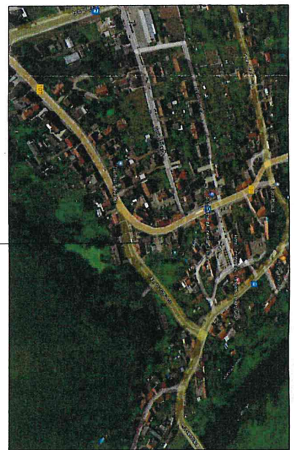
Nutzungsänderung auf Flurstück 27/1

- im Umkreis von 150m befinden sich Wohnhäuser und Gewerbegebäude - das Bauvorhaben befindet sich im Innenbereich der Gemarkung Treben