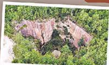
Der Rochlitzer Porphyrtuff wurde 2022 als „Weiterbestein“ ausgezeichnet. Rekordverdächtig: Der Gleisbergbruch auf dem Rochlitzer Berg mit 60 m Tiefe

Über 100 Geotope gibt es im Porphyrland. 18 von ihnen sind besonders sehenswert. Drei davon sind sogar als „Nationales Geotop“ ausgezeichnet.