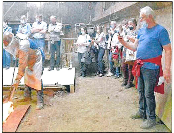
Auf der rechten Seite die Altenhainer Delegation an der Glockengrube. Links sieht man, erfolgt gerade der Guss der großen Glocke für Altenhain. Die helle Flamme verbrennt dabei, die über die Entlüftungslöcher austretenden Gase.

Auf Geheiß der Chefin: „In Gottes Namen“, wird ein Schieber entfernt, die Bronze läuft in die Gussform und verdrängt dabei die dort befindliche Luft, welche durch die Entlüftungslöcher, zusammen mit anderen Gasen, austritt. So wird nun eine Glocke nach der anderen gegossen und nach einer viertel Stunde ist es geschafft.