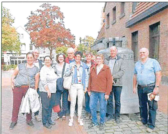
Gruppenbild der Altenhainer Delegation vor dem Verwaltungsgebäude der Gießerei Petit und Gebr. Edelbrock in Gescher.

Aktuelles aus der Glockengießstadt Gescher: