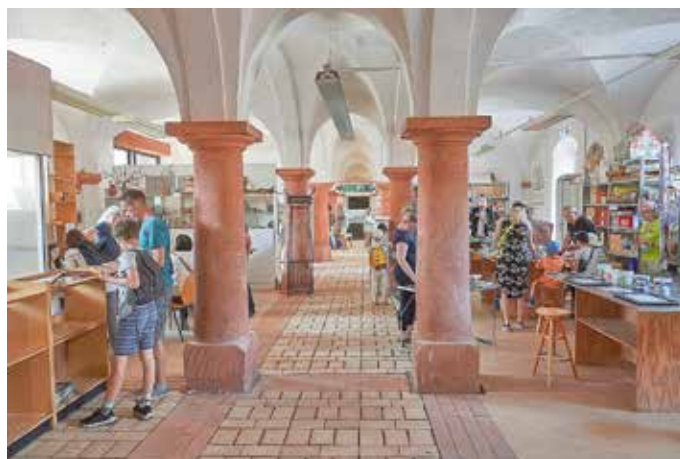
Aktivitäten zum Fest der Edlen Steine in den historischen Gemäuern des Rittergutes Trebsen

oder der Lebenswelt von geschützten Tieren in Tagebauen und Steinbrüchen sind nicht nur für Fachleute von Interesse. Auf der Mineralien- und Fossilienbörse präsentieren regionale Sammler zum Kauf ihre heimischen Mineral- und Fossilfunde. Natürlich ist auch für das leibliche Wohl gesorgt mit einem warmen Imbiss, mit Kaffee, Kuchen und Eis. Karten für Erwachsene zum Preis von 10,00 EUR /pro Pers. (Jugendliche bis 16 Jahre und Kinder frei) sind am Veranstaltungstag vor Ort zu erhalten.