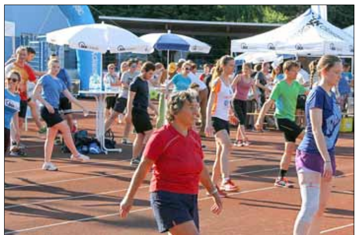
Sportabzeichentag in Grimma 2017

Alle aktuelle Infos und Materialien finden Sie online unter www.muldental-triathlon.de .