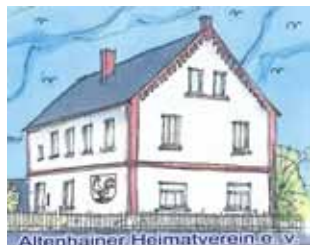
Altenhainer Heimatverein e.V.